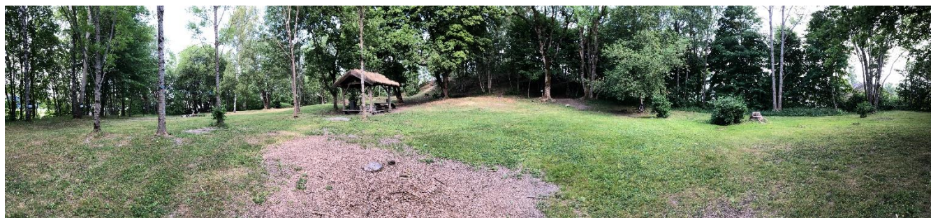
Vikingplassen v/ Askim museum

Påmeldingen lukkes og blir bindende fredag 5/10 klokken 23:59